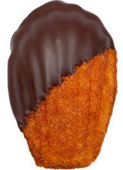
ショコラマドレーヌ75%