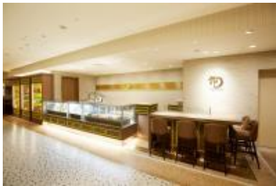
渋谷ヒカリエ ShinQs 店