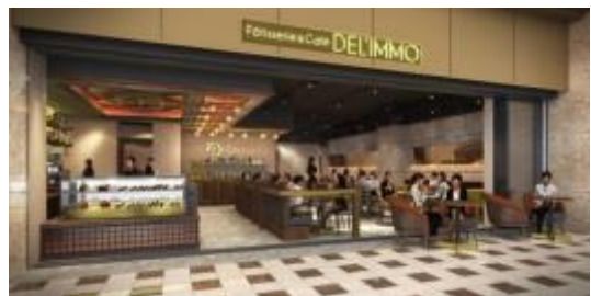
東京ミッドタウン日比谷店