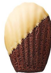
ブロンドショコラ マドレーヌ35%