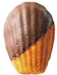
ショコラマドレーヌ56%