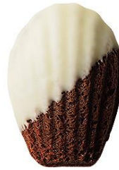
ショコラマドレーヌ37%