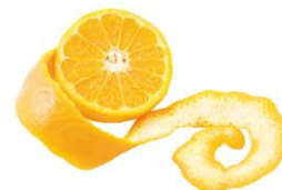
※マンダリンオレンジ果皮エキスイメージ