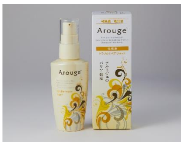
「アロージェ トラブルリペア リキッド」

※2 複合的な肌トラブルとは、ニキビ・吹き出物・赤み・ザラつき・かゆみなどです。