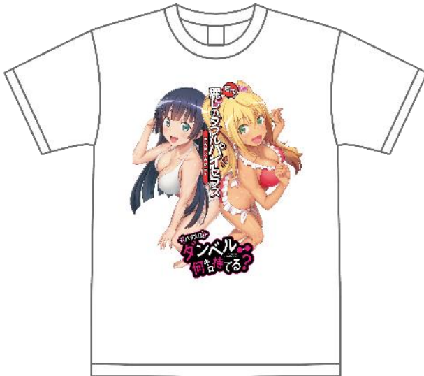
オリジナルTシャツ