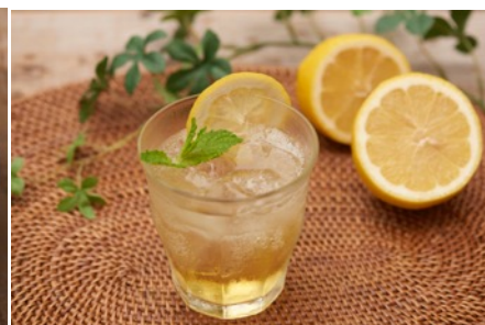
レモンティーソーダ ¥300

水分、糖分、ビタミンCを同時に取れるレモンティーはアウトドアの強い味方。炭酸も加わり、アジア料理にもぴったり！