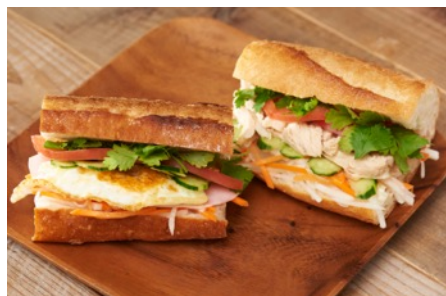
バインミー ¥650 (エッグ・チキン2種)

今回のソトレシピKitchenは、暑い夏に思わず食べたくなる「アジア料理」とそれに合う「紅茶ドリンク」でお出迎え。アウトドア料理ユニット「パエリアン」が提供します。