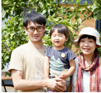
夫婦BBQユニット うすい会さん