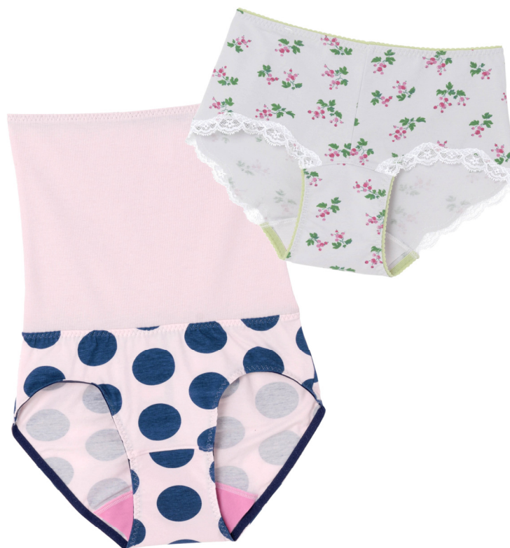
写真：「ウンナナクール」×「ルナルナ」 コラボサニタリーショーツ

また、からだや健康に対する意識が高い「ルナルナ」会員の、意見や要望を反映させたサニタリーショーツを販売することで、200万人の「ルナルナ」会員をはじめとする幅広い女性たちに向けて、生理期間を快適に過ごすために必要なアイテムであることを訴求し、サニタリーショーツのイメージ向上と売上拡大を図ります。