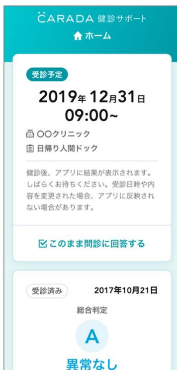
『CARADA健診サポート』アプリ トップ