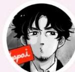
5 歳 株式会社アマヤドリ 代表取締役社長