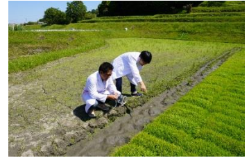
匂い採取時の様子