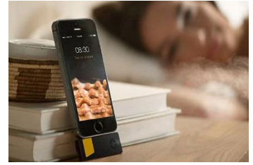
アプリ「Wake Up & Smell the Bacon」