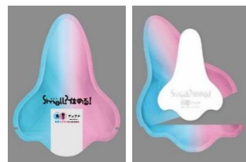
オリジナルシート(イメージ)

イベント名 : 「Smell?住める!匂いで体感!島&都市デュアル」 期間 : 2018年6月25日(月)~7月1日(日) 時間 : 平日12時00分~21時00分、土日10時00分~21時00分 設置場所 : 東京メトロ丸ノ内線新宿駅メトロプラザナード 媒体名 : 新宿メトロスーパープレミアムセット 特設サイトURL : https://shimatoshi.jp/smell