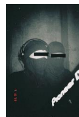
Follow The Shadows