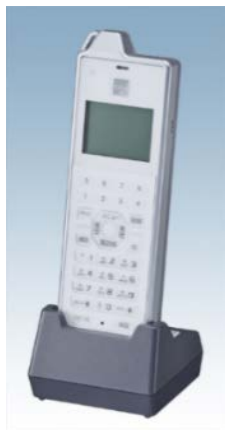
マルチラインシステムコードレス電話機「PS800」

今回、マルチラインシステムコードレス電話機をラインアップすることにより、PLATIA II をより快適、便利にご利用いただけます。