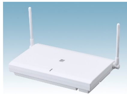
マルチラインシステムコードレス基地局「CS800」