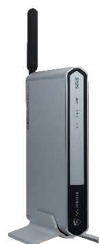
SS7000 II Pro（据え置き用品はオプション）

令和4年中に警察庁に報告されたランサムウェアによる被害件数は230件と、前年比で57%増加しており、サイバー攻撃による脅威は極めて深刻な情勢が続いています※2。また、その被害は企業・団体等の規模やその業種を問わず広範に及んでおり、大規模企業のみならず中堅・中小企業においてもオフィスにおけるネットワークセキュリティ対策は必須です。