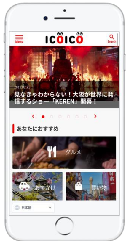
<icoico スマートフォントップページ>