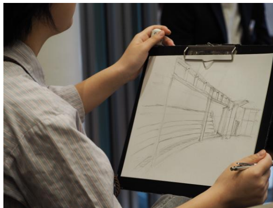
多目的ホールを描く学生