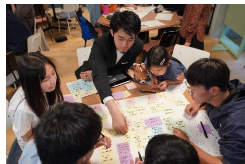
家族で参加することで一緒に成長できる。