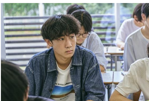
類塾プラスは集団授業の塾です。

当社は、今回の名称変更にあわせて、これまで提供してきた集団授業に、 学力と本気をひきだす6つの価値 をプラスします。またオンライン授業を提供してきた「類塾 オンライン教室」は、「類塾プラス バーチャル校」に名称変更いたします。