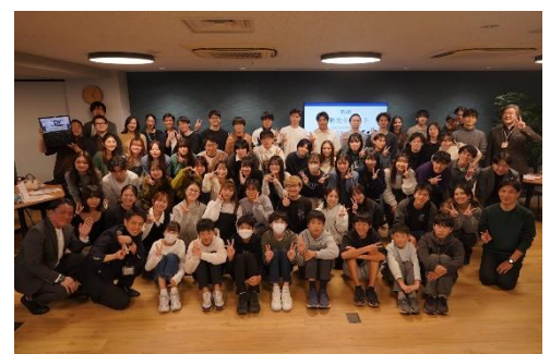
50年で15万人以上を輩出しました。