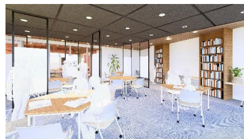
ひらかれた教室空間（イメージ）