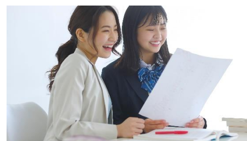
生徒をサポートするチューターの大学生（イメージ）