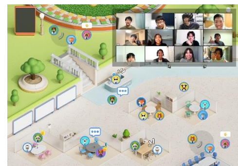
学びのメタバース空間（イメージ）