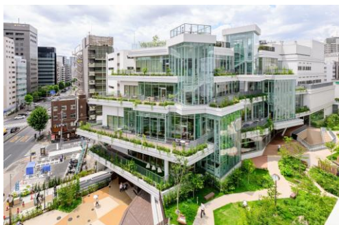
中央区立図書館「本の森 ちゅうおう」

また大阪本社では教育事業「類塾プラス」を 50 年にわたり運営し、これまでに 15 万人の卒塾生を社会に送り出しています。つまり、設計事業と教育事業を追求し展開し続けてきた、最前線で活躍する現役の一級建築士と教育のプロたちがいる企業です。“頭と心で学ぶ”、本格的なプログラムでこれからの未来を担う人材を育てます。