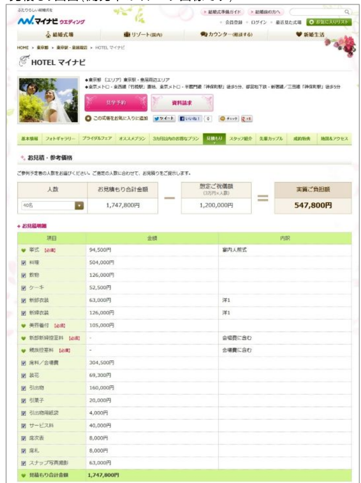
見積もり画面（開発中のイメージ画像です）

《結婚式費用が気になるユーザーにオススメ》 招待人数や必要項目ごとに見積もりを計算することができ、挙式や披露宴の想定価格を明確に提示することができる「見積もり機能」を搭載。 さらに、招待人数から割り出した「ご祝儀額」を差し引いた、実質の「自己負担額」も算出できます。 ユーザーが最も気になる予算・金額面での不安を解消します。