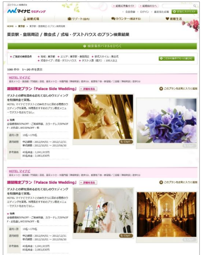
プラン検索結果画面（開発中のイメージ画像です）

《式のイメージが固まっているユーザー向け》 すでに人数や予算、具体的なイメージが固まっている人には、その内容を実現できる会場のプランにすぐにとどり着ける「プラン検索機能」を搭載。 「地域」「会場タイプ」「人数」「予算」「プランに含まれるもの（料理・ケーキ・美容着付・写真）」などの検索軸から、その条件を実現できる会場とプランを表示します。