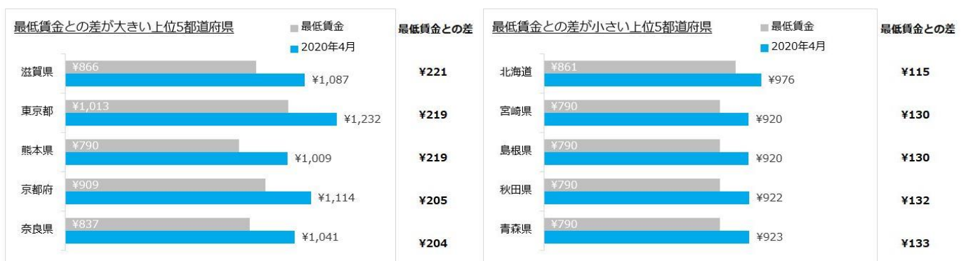
【図3】都道府県別 平均時給と最低賃金差 (一部抜粋)