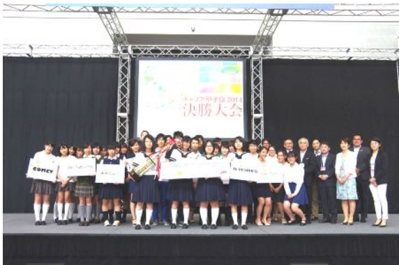
「キャリア甲子園 2014」には250組1,000名を超える高校生が参加。決勝大会には合計8チームが勝ち進み、企業を前にプレゼンテーションを行いました。

《昨年の決勝大会の様子（2014年7月28日 さいたまスーパーアリーナにて開催）》