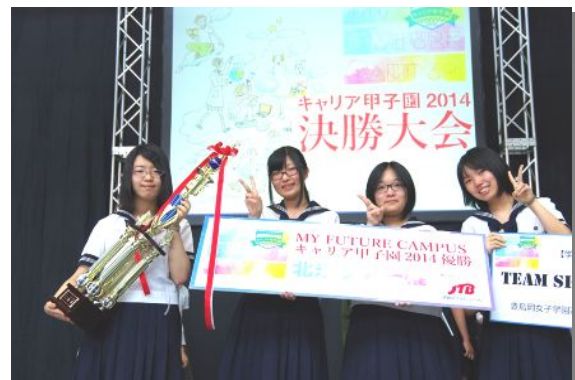
優勝したのは、豊島岡女子学園「Team SHOCK」。働く女性をターゲットにした「バーチャル試服」というビジネスを提案。プレゼン能力の高さが審査員に評価され、初代キャリア甲子園王者に輝きました。