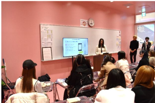
↑ステルスマーケティングの注意点を説明