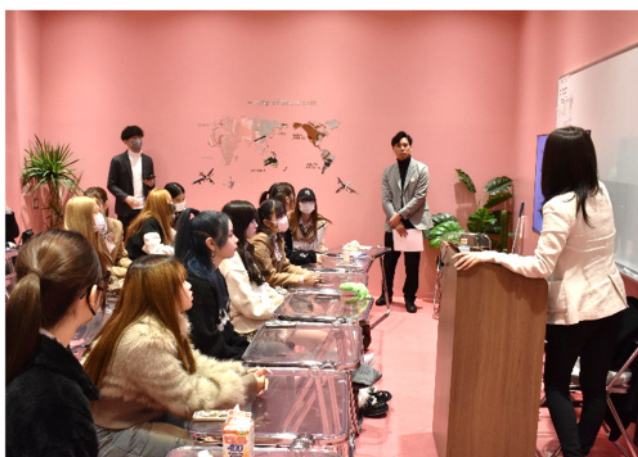
↑「闇バイト」の対策方法を聞いている様子