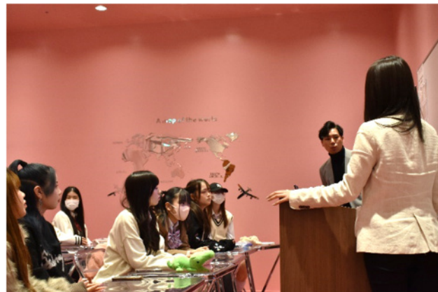
↑高校生が授業を聞いている様子