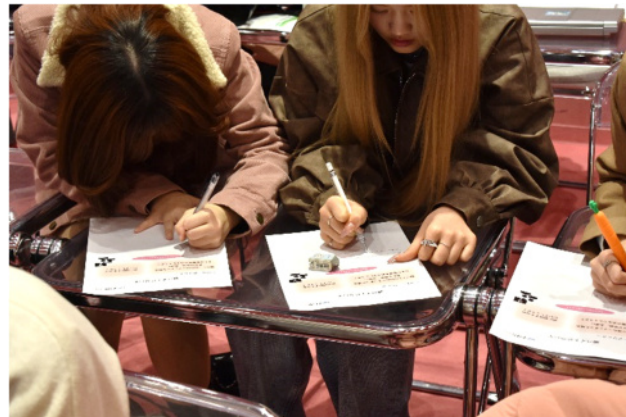
↑ワークシートにメモをしている様子