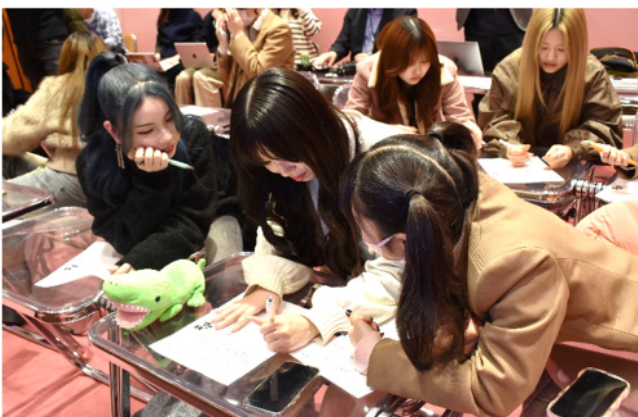
↑「闇バイト」に関わってしまった場合に関して議論している様子