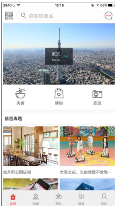
<アプリトップページ>