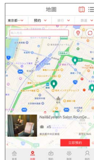
<クローク予約（地図検索）画面>

カフェやネイルサロン、スポーツジムなど、空きスペースを活用しクロークサービスを提供する店舗は増加しています。荷物の預かり場所は従来考えられる以上の広がりを見せています。それらをアプリ上で簡単に探せることで、訪日観光客の利便性に寄与します。