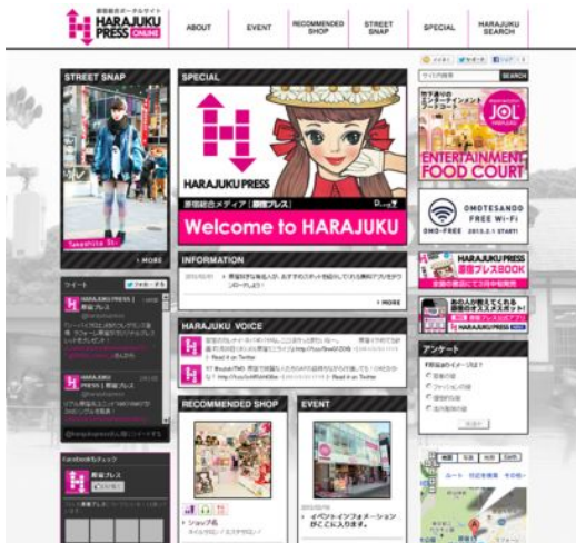
『HARAJUKU PRESS ONLINE』トップページ(イメージ)