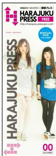
『HARAJUKU PRESS FREE』表紙(イメージ)