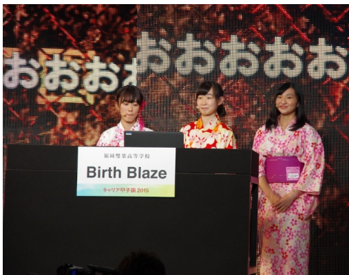
&lt;昨年度の決勝大会プレゼンの様子&gt;

第3回目の開催となる今年は昨年より応募者が増加し、全国から過去最多の673チーム2,647名の応募がありました(第1回:250チーム計1,026名、第2回:460チーム計1,800名)。決勝当日は書類審査、プレゼン動画審査、準決勝を勝ち抜いた5チームが、現役高校生が社会人として活躍する「2023年のビジネス」について、各企業から出題されたテーマに対して、新規事業プランをプレゼンテーションします。出場生徒はこの日のために、企業や社会の見方、ロジカルシンキング、プレゼン力を学ぶ専用講座を受け、ビジネススキルを磨き上げて決勝に臨むため、レベルの高い戦いとなることが予想されます。なお、当日の様子は「ニコニコ生放送」でインターネット生中継を行います。(配信URL: http://live.nicovideo.jp/watch/lv291922570 )