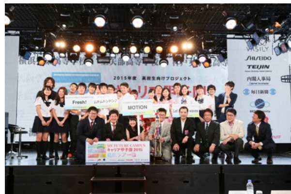
&lt;昨年度の決勝大会の集合写真&gt;

昨今、強く推進が求められている産学連携による「キャリア教育」の取り組みとして、ぜひご取材いただけますようお願い申し上げます。