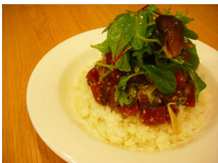
三陸沖初鰹と新玉葱のマリネ丼