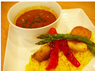
北海道産アスパラと季節の野菜の スープカレー