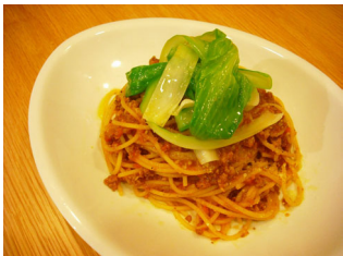
ボロネーゼ(ミートソース)パスタ うるい添え