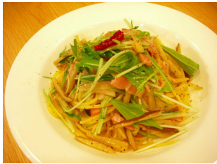
秋田特産いぶりがっことベーコンの ペペロンチーノ

レコールバンタン 〒153-0051 東京都目黒区上目黒 1-3-3 サンタスビル tel:03.5720.2813 fax:03.5704.8287 http://www.lecole.jp