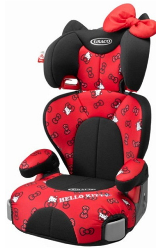
©1976, 2013 SANRIO CO., LTD. ㊄