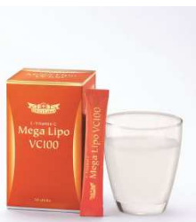
メガリポVC100 2.8g x 30包 7,800円(+税)

https://www.ci-labo.com/shopping/product/00052648/