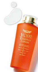
VC100エッセンスローション 150mL 4,700円(+税)

高吸収型ビタミンCを1,000mg配合。『メガリポVC100』は独自の“ナノカプセル技術”による“リポ化”で、吸収率が高く、体内に長く留まり、働き続ける最新鋭のビタミンC「高吸収型ビタミンC」を配合。ビタミンCの体内使用率を高め、その効果を十分にサポートします。飲みやすい、ほのかに酸味のあるさわやかな柑橘風味。