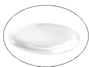
濃厚リッチでとろみのあるテクスチャー