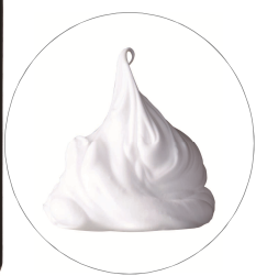
2018年8月24日発売 ジェノマー エステパック 90g ¥8,500(+税)

停滞しがちな年齢肌の肌温度に着目し、めぐりケアをパワーアップ。見違えるような艶やかな肌へ