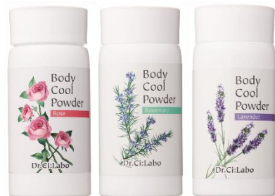
3種の香り ローズ ローズマリー ラベンダー