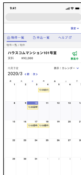
<オーナー様管理画面イメージ>

ハウコムは、2015年より「オンラインお部屋さがし」の仕組みをスタート、賃貸取引に係るITを活用した重要事項説明（IT重説）も2017年の本格運用開始より積極的に活用を進めており、全店舗でオンライン接客での対応が可能です。「スマート内見」は、ハウコムのオンライン接客のクオリティをさらに向上させていくための取り組みのひとつともなっています。