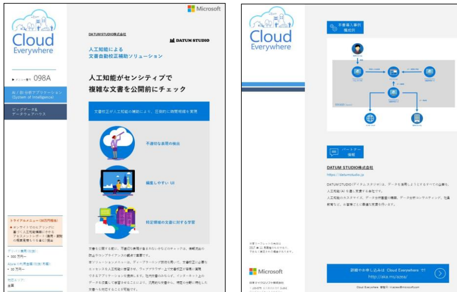
※ Microsoft Cloud Everywhere サイトの本ツール ページイメージ

《Microsoft Cloud Everywhere メニュー番号 098A》 (WEB) http://aka.ms/azea/