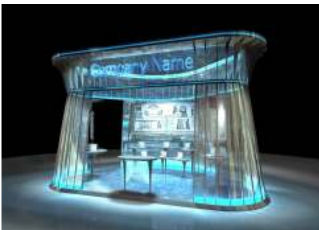
バーチャルブース イメージ

「SHANON VIRTUAL EVENT」は、バーチャルイベントのコンテンツ管理、開催までをスピーディかつワンストップで提供するクラウドアプリケーションです。ビジネスでの利用が促進されるよう、シンプルで見やすい画面や直観的な操作を実現しています。シャノンでは、初年度目標として、20社への導入を見込んでいます。