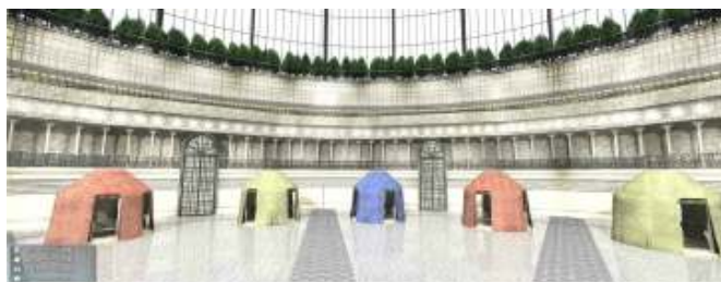
展示ホール イメージ