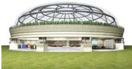
エントランス イメージ