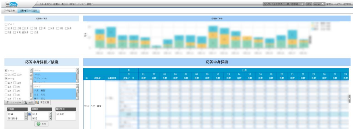
ダッシュボードイメージ

「SMP連携ダッシュボード」を活用することにより、シンプルな操作で蓄積されたデータの可視化が可能になりました。