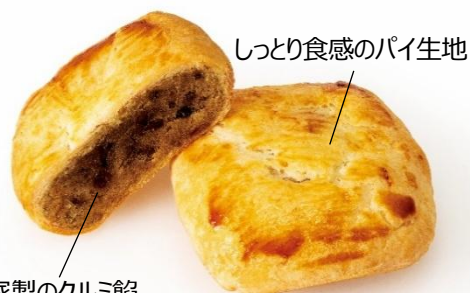
自家製のクルミ餡 餡1.3倍、クルミ1.5倍！ ※従来比