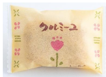
1993年リニューアル時のパッケージ