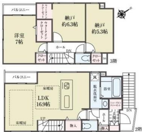
2階・3階住居スペース