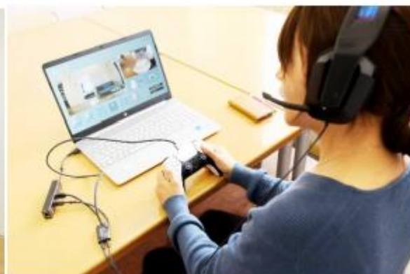
ミレルンを通じた接客の様子