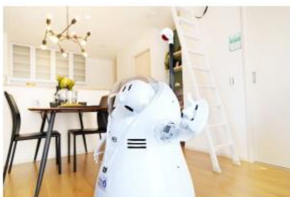
住宅展示場案内ロボット（愛称：ミレルン）

※ミレルン特設ページ https://www.casa-robo.ai/robo-milelun/