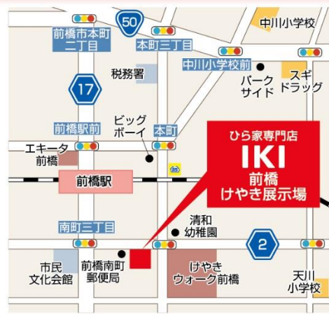
NAVI 前橋市南町3-76-1 付近