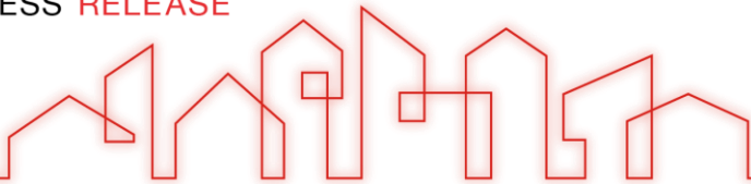
【ハウスタジオ A 棟】