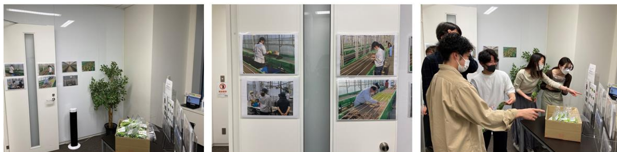
※1…2022.5.9 ケイアイファーム 初出荷のベビーリーフを従業員へ配布

2022 年 4 月 20 日には、ベビーリーフを初出荷し、当社の東京本社にて従業員間の交流を目的に配布会を行いました。ケイアイファームの社内認知の向上と従業員間の交流を深めること、さらに従業員の健康促進を目的に、一部の従業員へ無償で配布しました。配布時は、当日の案内であったにも関わらず列を作るほどの大盛況となり、40 袋あったベビーリーフはおよそ 5 分で配布終了となりました。（※1）