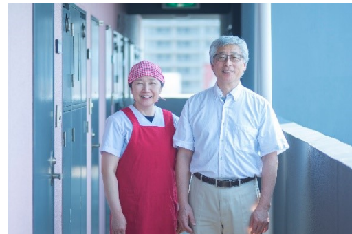
寮長寮母夫妻(イメージ)

一橋大学が主催する「2021 第1回 HOUSE 会議」(Housing Officers For University Student Education)は、「 学生が安心して過ごせる教育寮の在り方 」をテーマに、学生寮運営に関わる大学教員や学生スタッフ、また企業関係者が、各学生寮の取り組みや問題点について意見交換を行う交流会です。現場担当者間のネットワーク構築を図り、学びの場として機能を果たし、今後の望ましい教育の在り方を考えていくことを目的としています。コロナ禍における学生寮内の感染対策や、入居率の悪化などで運営継続に苦慮する中、参加者がアイデアを持ち寄り議論します。