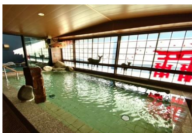
天然温泉大浴場(イメージ)

https://www.hotespa.net/hotels/hiroshima_ax/