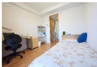
<家具備え付きの部屋>

ドミーではベッド、机、椅子、クローゼット、カーテン、Wi-Fiなどの設備が備え付けられており、入居後の生活を早期に安定させられます。さらに、便利なマンスリーセットにはテレビや電気ポットなどもありお得。テレワークにも対応した快適な生活をすぐ送る事が出来ます。