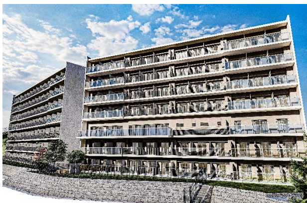
【外観】KU ROKKO HOUSE