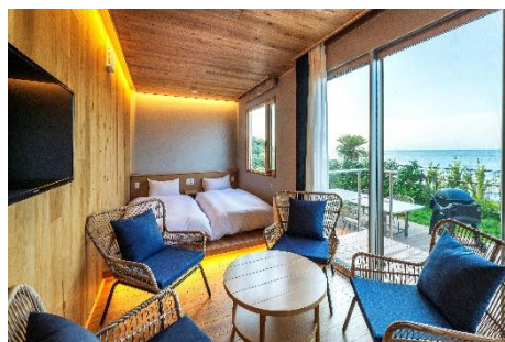
グランピング内一例