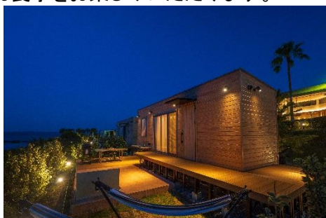
グランピング外観

ホテル敷地内には、東京湾を一望できる場所にグランピング施設を完備し、手軽に海辺のキャンプをご満喫いただけます。夕食は、グランピング前のテラスにて、セルフBBQをご用意しており、アウトドアを感じながらお食事をお楽しみいただけます。