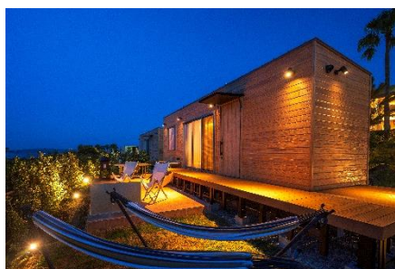
グランピング外観

ホテル敷地内には、東京湾を一望できる場所にグランピング施設を完備し、手軽に海辺のキャンプをご満喫いただけます。夕食は、グランピング前のテラスにて、セルフBBQをご用意しており、アウトドアを感じながらお食事をお楽しみいただけます。