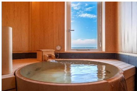
無料貸切風呂一例