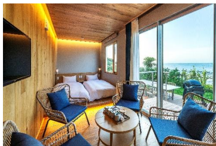
グランピング内一例