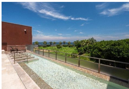
天然温泉眺望露天風呂

『ラビスタ観音崎テラス』公式 WEB サイト: https://www.hotespa.net/hotels/la_kannonzaki/