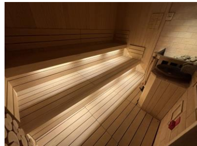
高温ドライサウナ (セルフロウリュ)