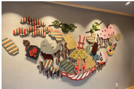
日本文化感じる装飾