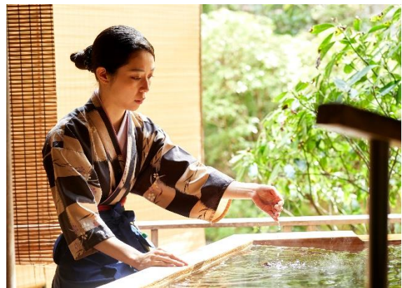
大浴場のオープン前準備（イメージ）