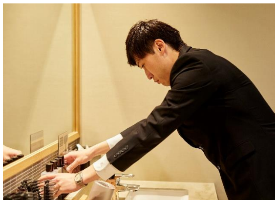
大浴場のオープン前準備(イメージ)