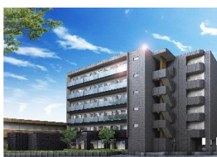
ドミー坂戸花町 外観(イメージ)

個別タイプの居室には全室専用Wi-Fi を完備。リモート授業やリモートワークにも対応するため、コワーキングスペースなども充実しています。また、体調管理の基本となる食事は、管理栄養士が考案したバランスの良いメニューを寮母が朝夕2食手作りし、提供いたします。