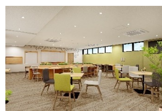
ドミー京都くいな橋 ダイニング(イメージ)

寮長寮母が常駐しているため、コロナ禍においてもしっかりと安全対策がとられており、万が一の時にも生活をサポートしますので安心してお過ごしいただけます。