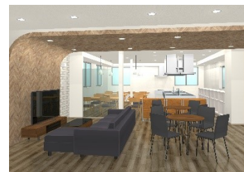
URBAN TERRACE 亀有 キッチン&ダイニング(イメージ)