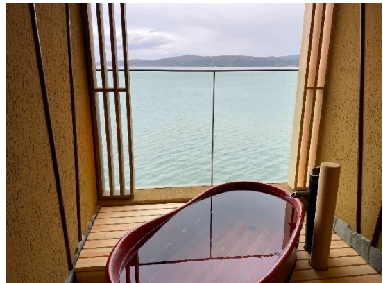
貸切露天風呂「陶器」