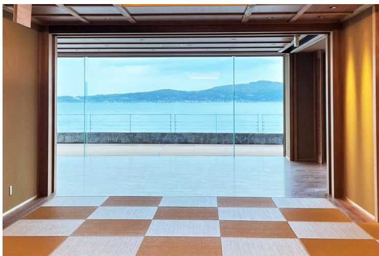
和倉温泉 白鷺の湯 能登 海舟

『和倉温泉 白鷺の湯 能登 海舟』公式 WEB サイト https://www.hotespa.net/hotels/noto_kaisyu/