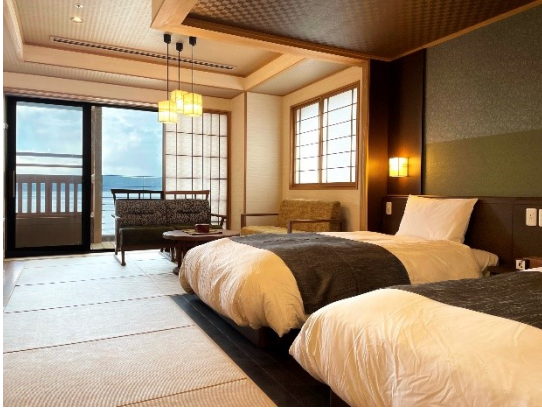
天然温泉露天風呂付の和洋フォース

上質な和の設えの客室は6種類ご用意いたしました。オーシャンフロントのテラスには天然温泉露天風呂を完備し、海景をさらに間近に感じることができます。