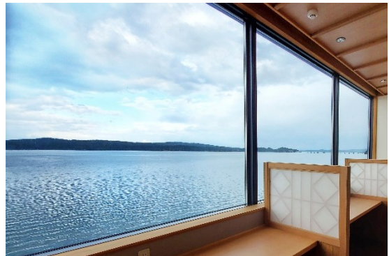
七尾湾に面したレストランカウンター