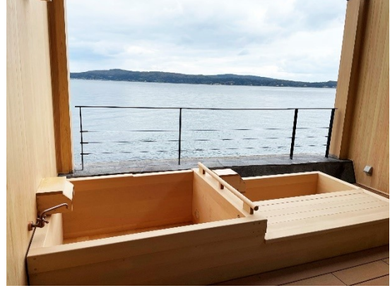
天然温泉露天風呂